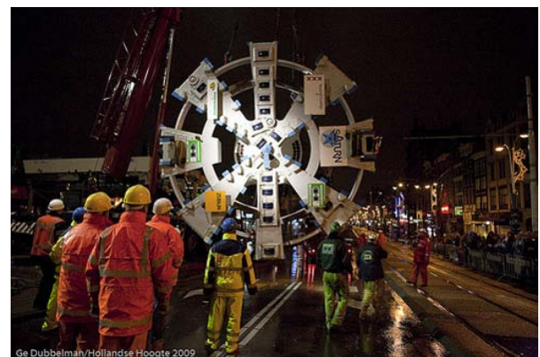
Noortje, de tweede tunnelboormachine Foto: Gé Dubbelman/Hollandse Hoogte 2009