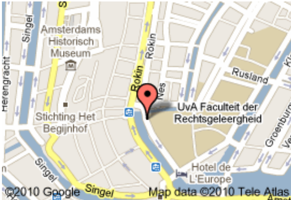
Locatie Allard Pierson Museum

Allard Pierson Museum , Tentoonstelling: Alexanders Erfenis - Grieken in Egypte Van 17-09-2010 t/m 20-03-2011