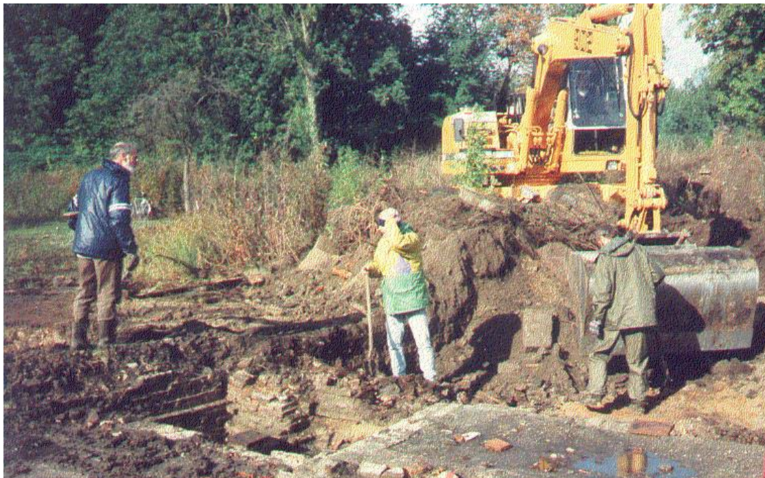
Opgraving 't Kalfje. Hier wordt groot materieel ingezet.