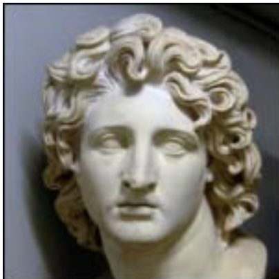
Alexander de Grote

Een tentoonstelling over wat Alexander de Grote (356-323 vChr) teweeg heeft gebracht. Alexander bracht elementen uit de westerse cultuur naar het oosten en omgekeerd elementen uit de oosterse cultuur naar het westen. Alexanders Erfenis gaat over deze wederzijdse invloed en (culturele) versmelting van volkeren.