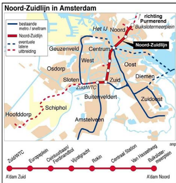
Het traject van de Noord/Zuidlijn

De bouw vordert nu goed. Uiteindelijk zal men in 16 minuten van Amsterdam Noord naar Amsterdam Zuid kunnen reizen. De reis gaat dan van het Buikslotermeerplein en de Johan van Hasseltweg in Noord, naar het Centraal Station, Rokin, Vijzelgracht, Centuurbaan en Europaplein naar Station Zuid.