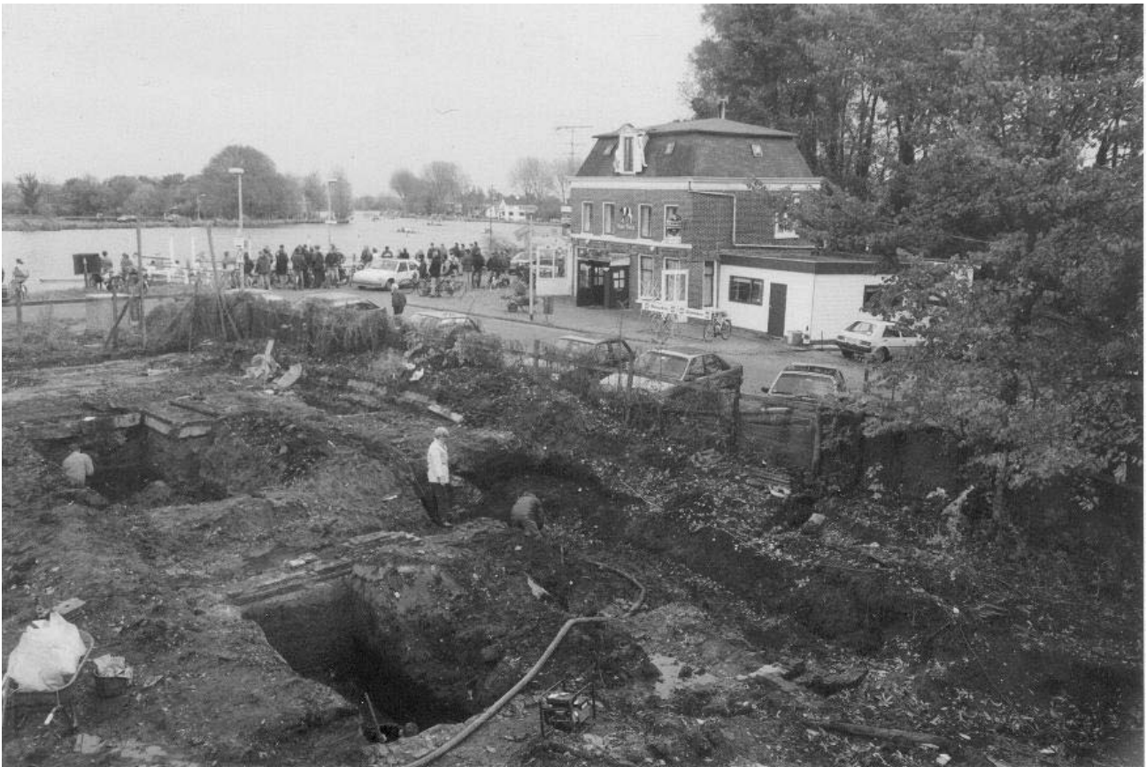
Opgraving door amateur-archeologen bij de voormalige herberg 't Kalffe in de jaren '90, gezien vanuit het westen. Op de achtergrond de Amstel. Rechts de huidige uitspanning 't Kalffe.

In het najaar van 1990 werd een eerste opgraving verricht in het Oude Dorp van Amstelveen. Hier werd het pand van het Amstelveens Weekblad aan de Dorpsstraat 54-50 afgebroken. Kort daarop werd het naastgelegen pand gesloopt, de zogenaamde wolwinkel op de hoek van de Dorpsstraat 50-52 en het plein van de Nederlandse Hervormde Kerk. Vastgesteld werd dat op deze beide locaties middeleeuwse bebouwing heeft gestaan. Met name de beide beerputten op de locatie van het Amstelveens Weekblad leverden veel interessante vondsten op.